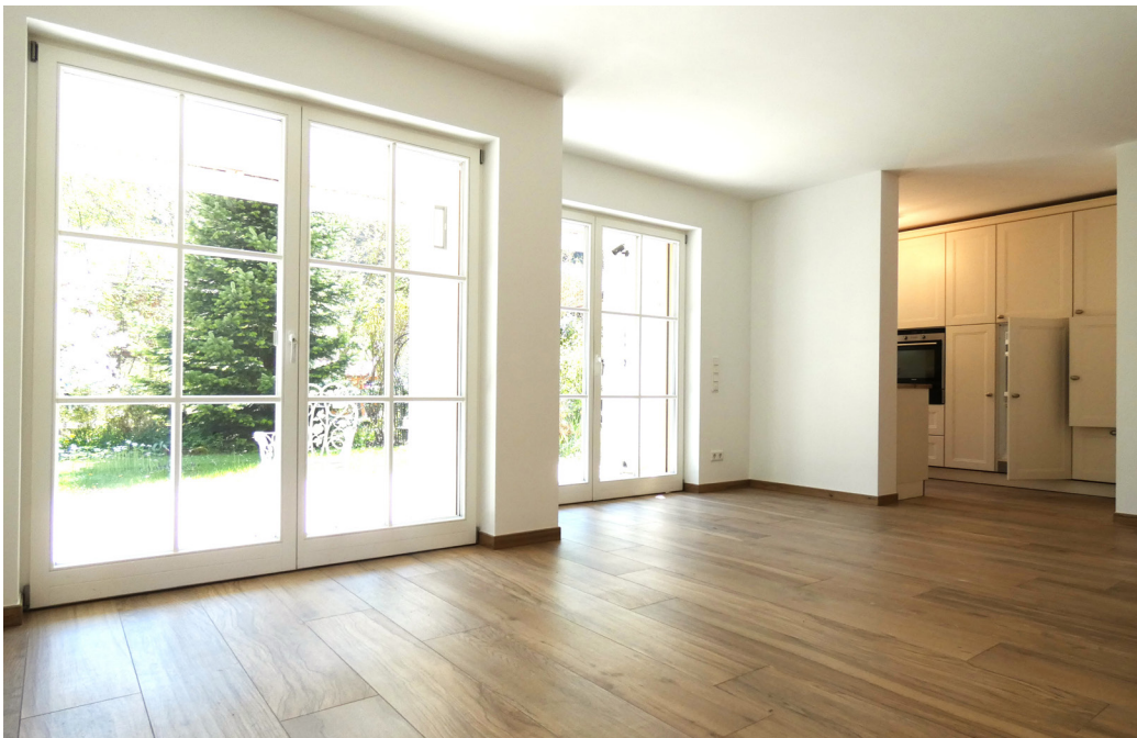
Wohnzimmer & Küche